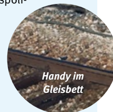
Handy im Gleisbett

Bloß nicht hinabsteigen – und möglichst verhindern, dass andere dies probieren. Sinnvoll ist es, umgehend die Aufsicht am Bahnsteig zu verständigen (Notrufsäule, falls vorhanden) oder mit Hilfe von Passanten die Bundespolizei anzurufen ( Telefon 0800 6 888 000 ). Diese Telefonnummer lässt sich mit den Suchworten „Bundespolizei Hotline“ schnell online finden. Man sollte sie aber auch für andere kritische Situationen beim Bahnfahren im Handy abspeichern.